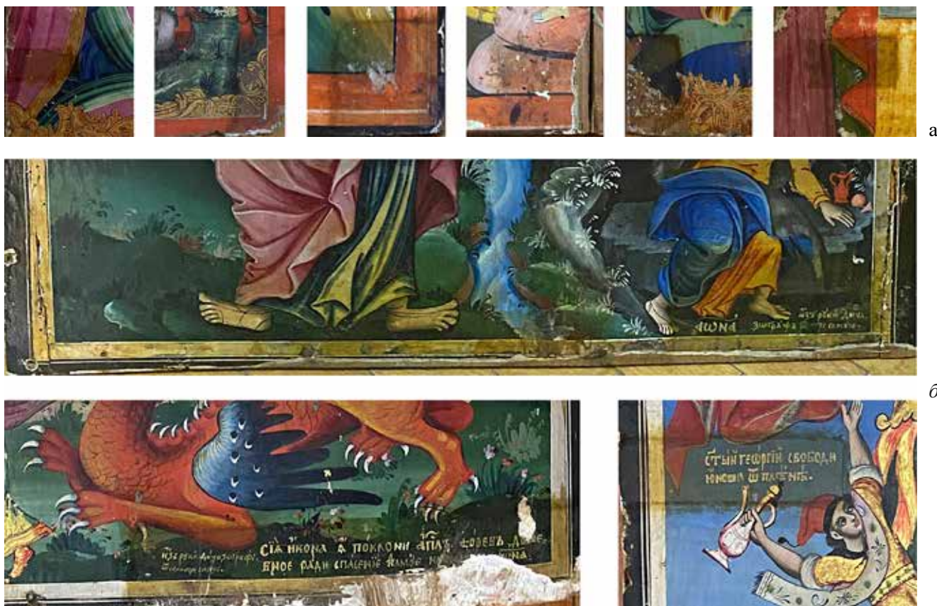
Сл.4 – Конзерваторски дејствија-отстранување на стари, пожелтени лакови: (а)–Детали од оставени сонди стари лакови, (б) - Оставен стар лак врз натписи, вршени од страна на непознато лице

Технологијата на нашите иконописни дела, особено сликањето со пигментирани лакови или испишување текстови врз позлатена позадина од