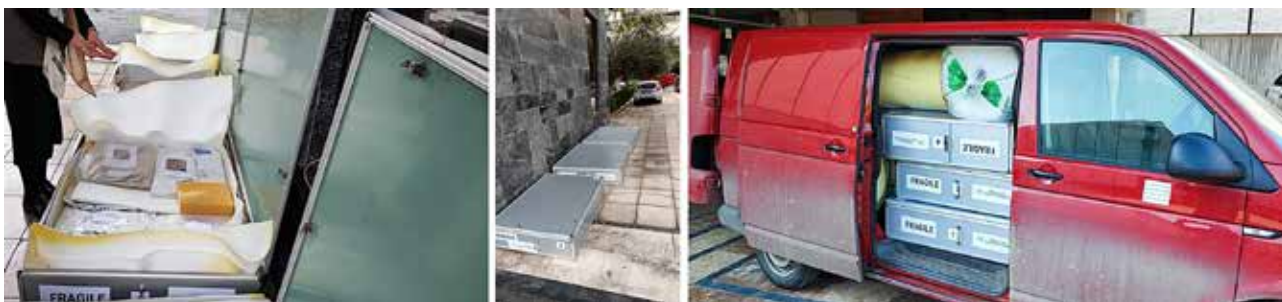
Сл. 7 – Транспорт: (а) - Пакување на икони во алуминиумски садаци во Националниот историски музеј во Тирана, Р.Албанија, (б) - Транспортното возило до НУ Музеј на С.Македонија

пакување на иконите се обезбедени сунѓери со дебелина од 1 и 2см, восочна заштитна хартија и најлони со меури. Изработен е точен список на иконите, нивните регистерски броеви и кодови, димензии и потекло, а секој сандак беше одбележан со свој број.