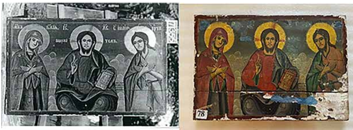
Сл. 5 – Локална боена интервенција на пределот на отпаднатиот иконопис

На работните состаноци при Министерството за култура стручните служби инсистираа за безбеден транспорт обезбеден со соодветни сандаци и за таа намена НУ Музејот на С. Македонија, отстапи дел од своите алуминиумски сандаци (за транспорт на експонати) во различни димензии, внатрешно обложени со странични стиропори и обезбедени со клучеви и брави поединечни за секој сандак. Внатрешните димензии на сандаците се усогласени со поединечните димензии на иконите, а димензиите на сандаците се ускладени со обезбеденото комби возило за транспорт, што ги задоволи соодветните внатрешни димензии за поставување на сандаците еден врз друг 3 x 2. За