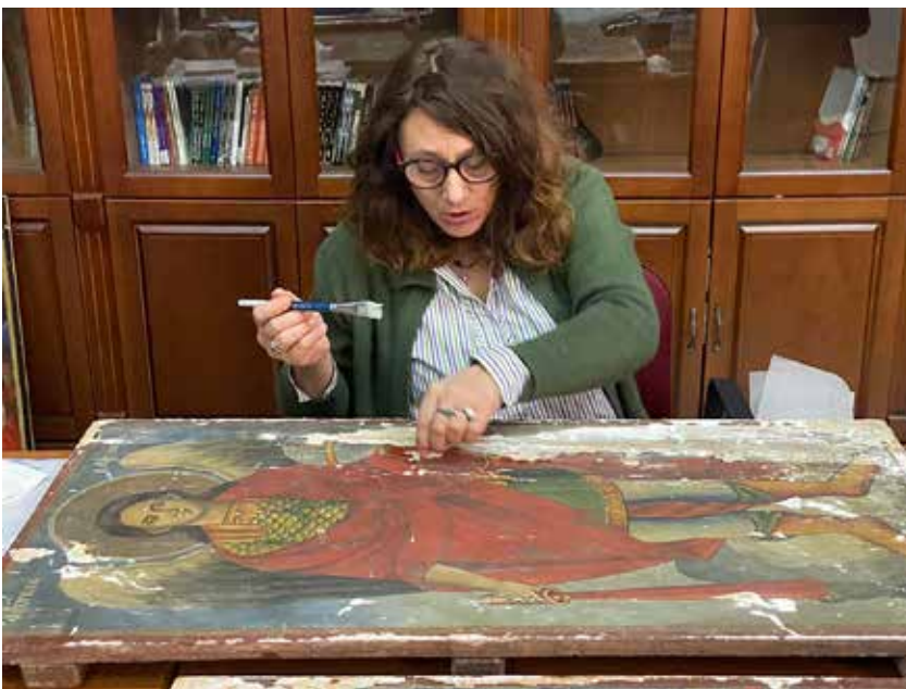
Сл. 6 – (б) - Вршени конзерваторски дејствија во насока на стабилизација на состојбата на 4 икони;