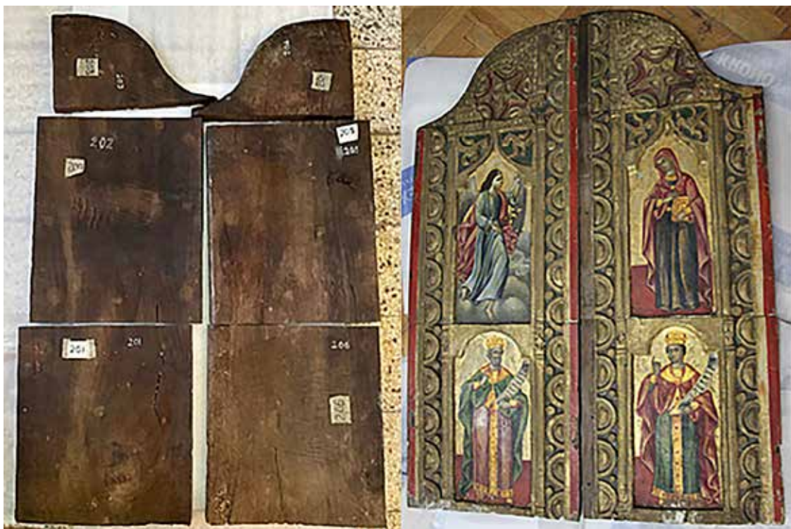
Сл.2 – Царските двери пресечени во шест делови (задна и предна страна)