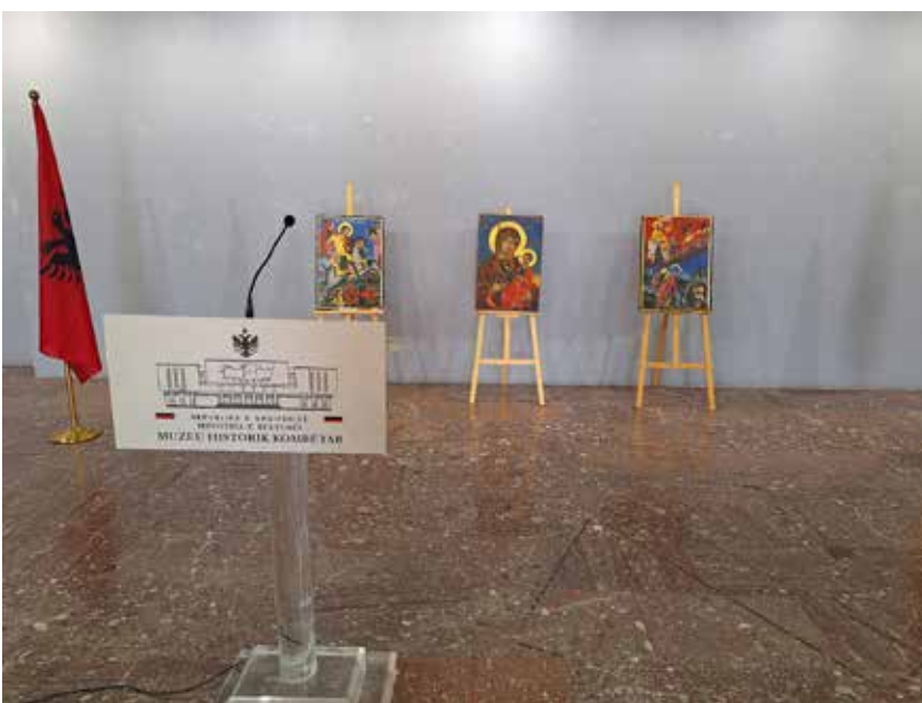
Сл. 6 – (в) - Три икони издвоени за церемонијалниот дел во Р.Албанија, изложени во холот на Националниот историски музеј во Тирана