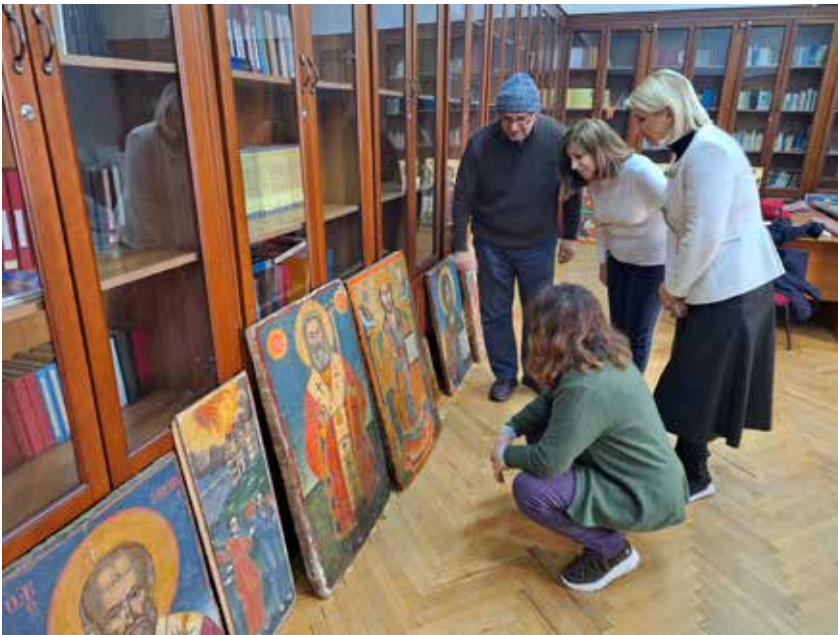
Сл. 6 – (а) Извршен увид кон состојбата на лице место;